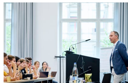
Figura 2: Thomas Zurbuchen, direttore scientifico della NASA, è stato l'ospite speciale di questa prima edizione.